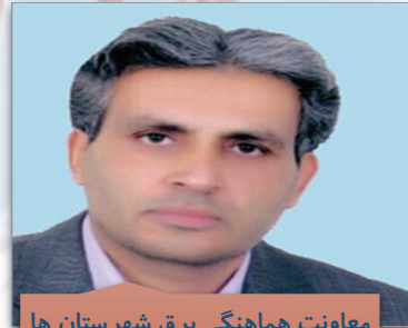
معاونت هماهنگی برق شهرستان ها