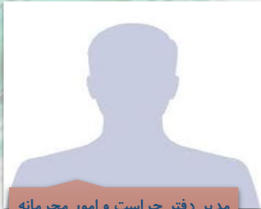
مدیر دفتر حراست و امور محرمانه