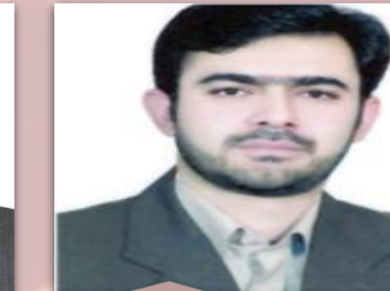
مدیر دفتر حقوقی