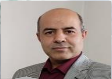
مشاور و مجری نیروگاههای خورشیدی دولتی