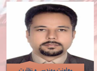
معاونت مهندسی و نظارت