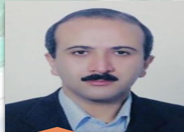
معاونت فروش و خدمات مشترکین