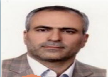
معاونت برنامه ریزی