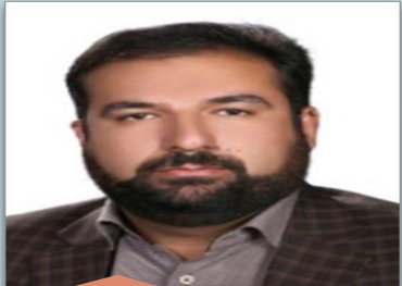
معاونت مالی و پشتیبانی