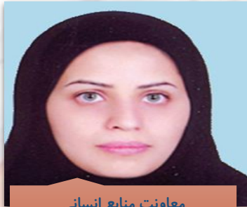
معاونت منابع انسانی