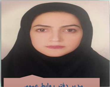
مدیر دفتر روابط عمومی