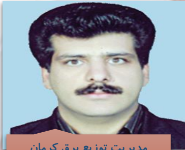
مدیریت توزیع برق کرمان