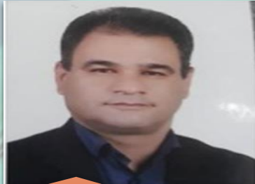
معاونت بهره برداری و دیسپاچینگ