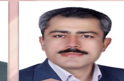
مدیر دفتر هیئت مدیره و مدیر عامل