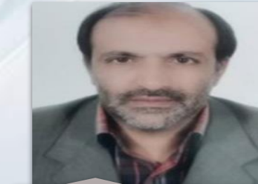
مشاور و مجری هوشمند سازی مشترکین